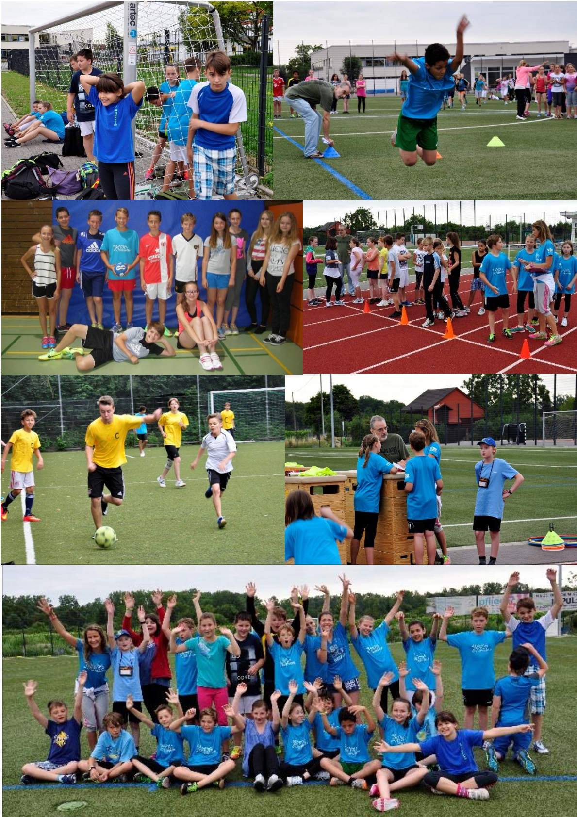
Die ehemalige 5d - Siegerklasse des Jahrgangs 5 (2013/14)